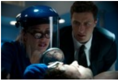
„Motive“ Szenenfoto © Universal Pictures

Cover & Szenenfotos © Universal Pictures