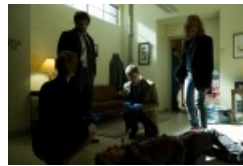
„Motive“ Szenenfoto