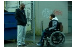
„Motive“ Szenenfoto