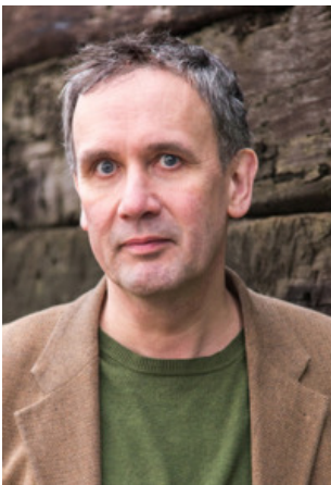
Volker Kutscher

Herr Kutscher, Sie sind als Krimi-Autor durch die Reihe um den Kommissar Gereon Rath bekannt geworden. Sind Sie mittlerweile Vollzeit-Autor?