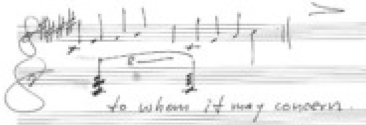
Manuel Göttschings Notation des zentralen Motivs von "E2-E4"

Doch "E2-E4" erwies sich als ein gut vorbereitetes Experiment und so gelang die Aufnahme beim ersten Mal. Dem Resultat wurden keine weiteren Overdubs hinzugefügt, es fanden auch keine nachträgliche Reparaturen einzelne Stellen statt. Es ist, was es ist. Die Aufnahme klingt so, wie sie das Studio verlassen hatte. Ein hypnotischer, treibender Sound. Eine Stimme aus der Zukunft. Und sogar dann, als sich bei der dreißigsten Minute aus all dem elektronischen Webmuster plötzlich Manuel Göttschings Solo-Gitarre herausschält, fühlt man sogleich das zukunftsweisende Echo der funkigen Deep-House- und Ibiza-Musik der späten 90er und frühen Nuller-Jahre. Es gibt kaum eine andere Platte jener Ära, die so weit in die Zukunft hinausblickt.