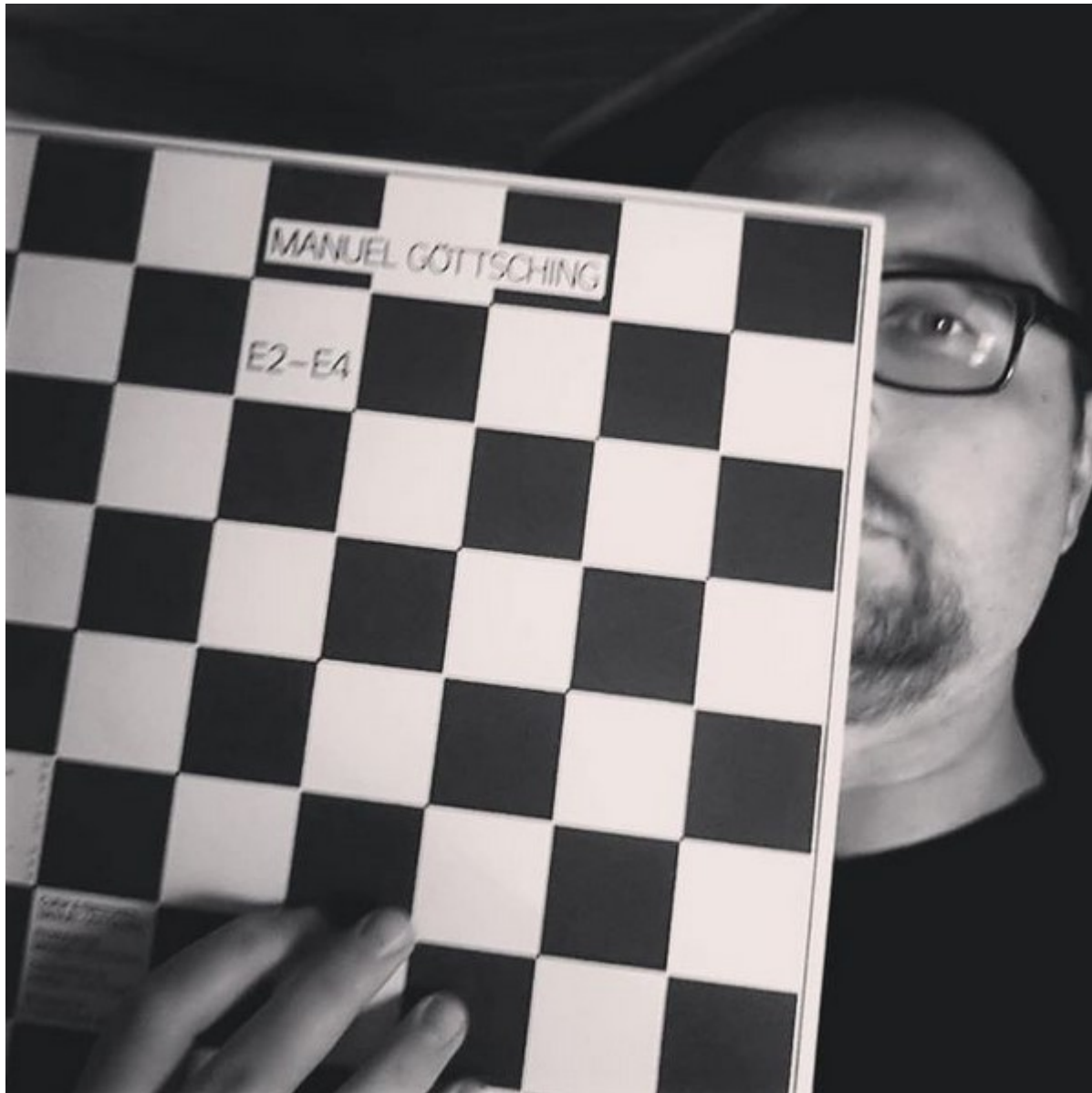
Manuell Göttsching: "E2-E4" (1981/1984, Inteam) „futuristic spaceship command room“ by Luca Oleastri @ fotolia

Diese Scheibe könnte man jederzeit auflegen und hierbei behaupten, es sei eine Detroit-Techno-Platte von 1995 oder eine minimalistisch Dubstep-Aufnahme von 2015. Es drängt sich geradezu der Verdacht auf, dass Manuel Göttsching ein Zeitreisender war, der die Zukunft sah und hörte. Den Tanz, der niemals zu Ende ist. Der ewige kosmische Groove.